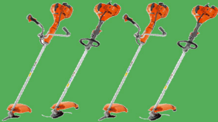
BC 420 S BC 420 T